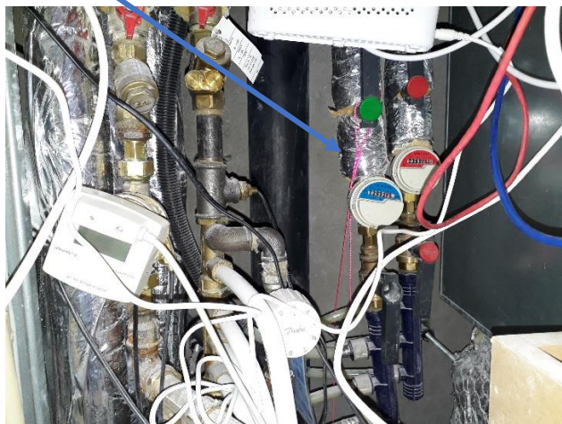
Figur 2 Lågen er åbnet

Når man åbner den hvide låge på badeværelset, ser man et virvar af rør, ledninger mm. I virvaret kan man finde en bomuldssnor, der er bundet fast et sted: