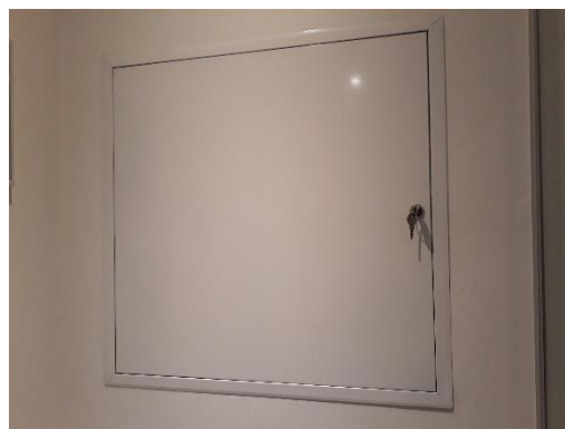
Figur 1 Lågen til teknikskabet

Ved hjælp af snoren kan man fiske lækagemeldereren op.