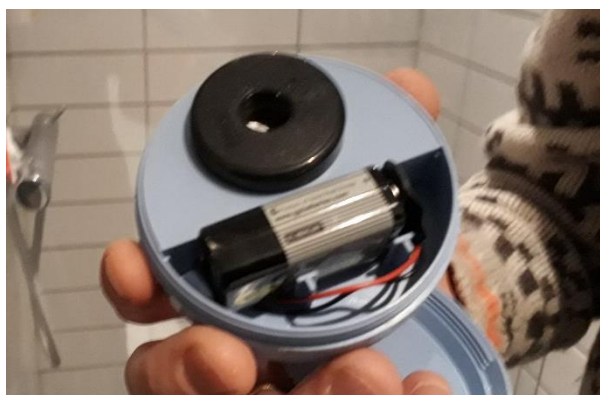
Figur 4 Her ses 9-volts batteriet

Den kan let åbnes og batteriet, der skal skiftes, kommer til syne: